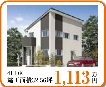
4LDK 施工面積32.56坪 1,113 万円

100以上のプランの中からあなたの理想のものをお探しください。※本体税別価格です