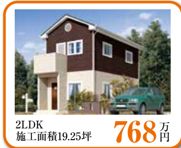
2LDK 施工面積19.25坪 768 万円