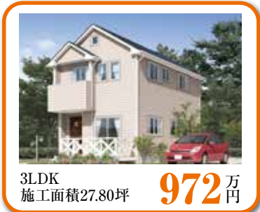
3LDK 施工面積27.80坪 972 万円