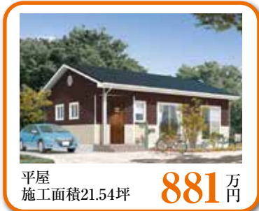
平屋 施工面積21.54坪 881 万円