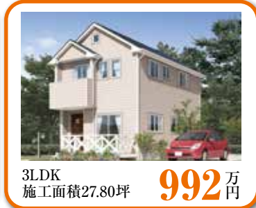
3LDK 施工面積27.80坪 992 万円