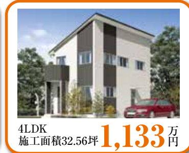
4LDK 施工面積32.56坪 1,133 万円

100以上のプランの中からあなたの理想のものをお探しください。※本体税別価格です