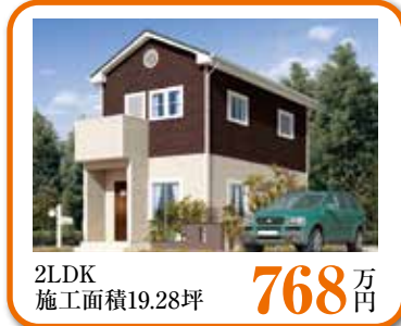
2LDK 施工面積19.28坪 768 万円