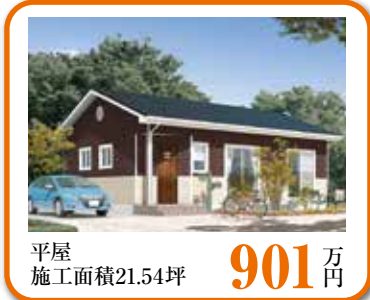
平屋 施工面積21.54坪 901 万円